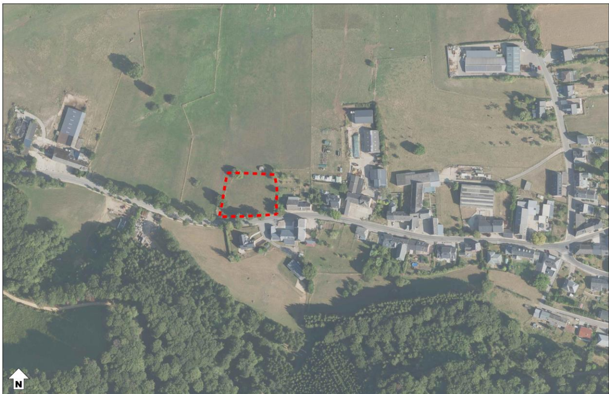
Abbildung 2 Verortung des Plangebietes (Luftbild)