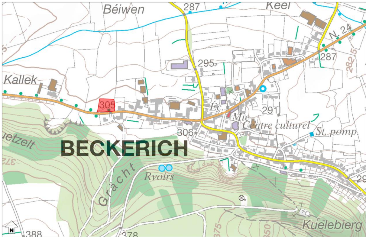
Abbildung 1 Verortung des Plangebietes (Topografische Karte)