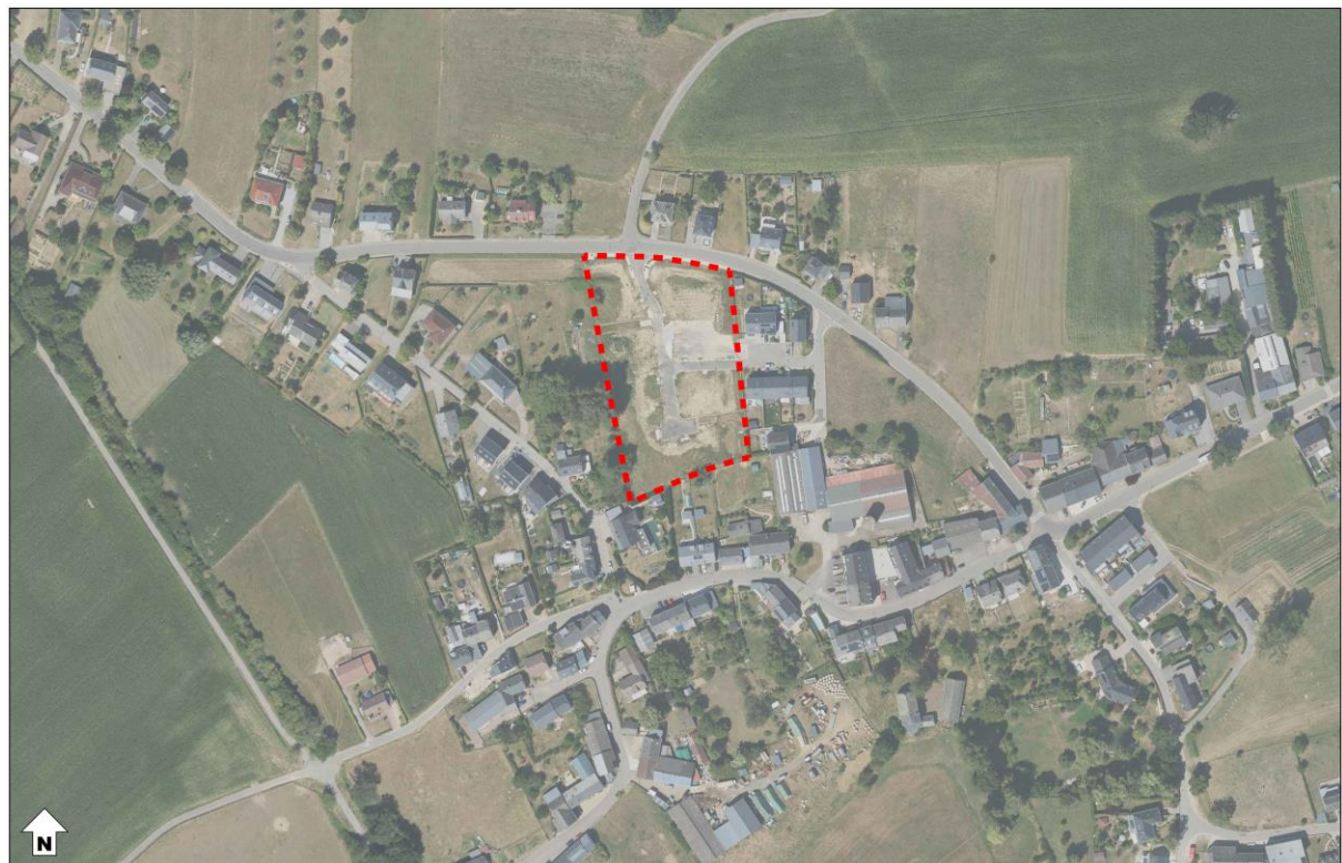
Abbildung 2 Verortung des Plangebietes (Luftbild)